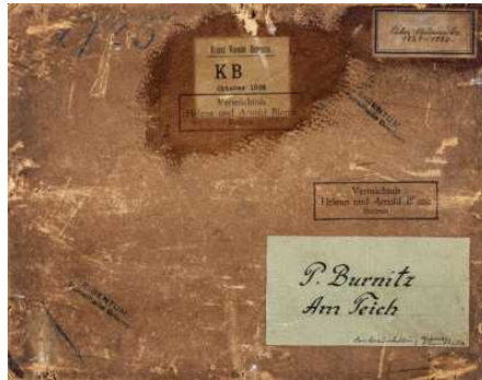
Provenienzforschung in der Kunsthalle Bremen