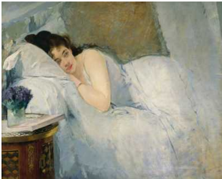
Französische Malerei vom Klassizismus zum Kubismus