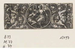
↗ Sebald Beham (*Nürnberg 1500 - † Frankfurt am Main 1550), Radierer Cimon und Pero , 1526-1530