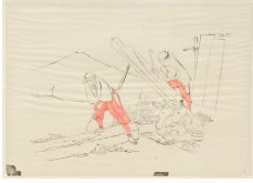
↗ Anonym, japanisch, 18./19. Jahrhundert (*1701 - † 1900), Formschneider Zimmerleute bei der Arbeit , 18./19. Jahrhundert