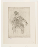
↗ Félicien Rops (*Namur 1833 - † Essonnes (bei Paris) 1898), Radierer Alter Arzt , 1848-1898