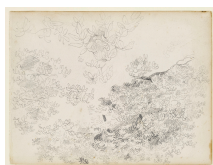
↗ Eugène Delacroix (*Charenton-Saint-Maurice 1798 - † Paris 1863), Zeichner Baumschlag und Zweige, aus: "Bremer Skizzenbuch", um 1823