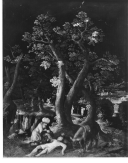
↗ Adam Elsheimer (*Frankfurt am Main 1578 - † Rom 1610), Maler Der barmherzige Samariter , 1. Hälfte 17. Jahrhundert