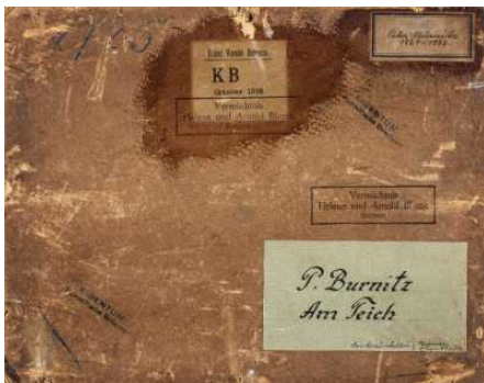
Provenienzforschung in der Kunsthalle Bremen