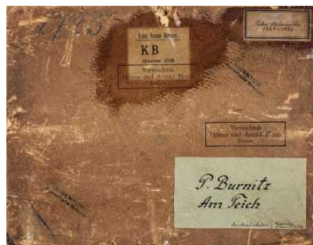
Provenienzforschung in der Kunsthalle Bremen