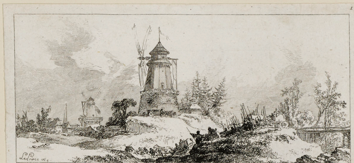
DIVERSES VUES DE LIVONIE. Dédiées à Monsieur Vernet Peintre du Roi. Par son très Humble et très Obeissant Serviteur Le Prince.