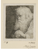
↗ Jean-Pierre Norblin de la Gourdain (*Misy-sur-Yonne (Seine-et-Marne) 1745 - † Paris 1830), Radierer Greisenkopf , 1774-1789