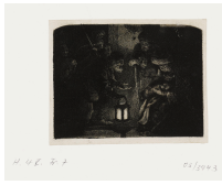
➤ Jean-Pierre Norblin de la Gourdain (*Misy-sur-Yonne (Seine-et-Marne) 1745 - † Paris 1830), Radierer Anbetung der Hirten , 1774-1789