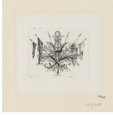
↗ Bernard Picart (*Paris 1673 - † Amsterdam 1733), Inventor Größere ornamentale Vignette mit Fahnen , um 1728