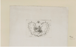
↗ Bernard Picart (*Paris 1673 - † Amsterdam 1733), Inventor Größere Vignette mit Mandolinespieler , um 1728