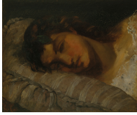
↗ Gustave Courbet (*Ornans 1819 - † La-Tour-de-Peilz 1877), Maler Kopf eines ruhenden Mädchens , um 1853-1855