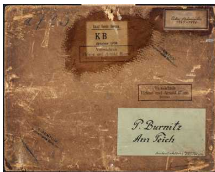
Provenienzforschung in der Kunsthalle Bremen