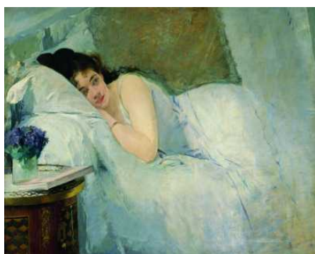
Französische Malerei vom Klassizismus zum Kubismus