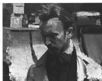
↗ Erich Hartmann (*Elberfeld 1886 - † Sylt 1974), Maler Bildnis eines Malers , 1909