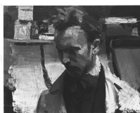
↗ Erich Hartmann (*Elberfeld 1886 - † Sylt 1974), Maler Bildnis eines Malers , 1909

Künstler Erich Hartmann (*Elberfeld 1886 - † Sylt 1974), Maler