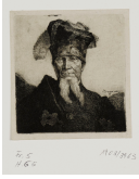
➤ Jean-Pierre Norblin de la Gourdain (*Misy-sur-Yonne (Seine-et-Marne) 1745 - † Paris 1830), Radierer Mazeppa , 1770