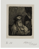
↗ Jean-Pierre Norblin de la Gourdain (*Misy-sur-Yonne (Seine-et-Marne) 1745 - † Paris 1830), Radierer Meditation , 1774-1789