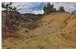
↗ Fritz Overbeck (*Bremen 1869 - † Bremen/ Vegesack 1909), Maler Sandkuhle , um 1898/1900