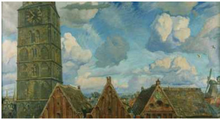
Bremer Malerei 1800 bis 1950 in der Kunsthalle Bremen