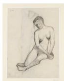
↗ Paula Modersohn-Becker (*Dresden 1876 - † Worpswede 1907), Zeichnerin Sitzender weiblicher Akt , 1905