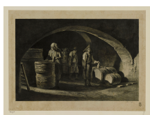
↗ Jean Jacques de Boissieu (*Lyon 1736 - † Lyon 1810), Radierer Große Tonnenmacher , 1790