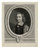
↗ Robert Nanteuil (*Reims 1623 - † Paris 1678), Stecher Bildnis Pierre Poncet , 1673