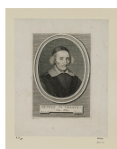
↗ Robert Nanteuil (*Reims 1623 - † Paris 1678), Stecher Bildnis Pierre Dupuy , um 1652