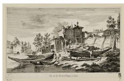
↗ Jean Jacques de Boissieu (*Lyon 1736 - † Lyon 1810), Radierer Vue de la Porte d'Ainay a Lion , 1761