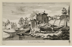
↗ Jean Jacques de Boissieu (*Lyon 1736 - † Lyon 1810), Radierer Vue de la Porte d'Ainay a Lion , 1761