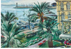
↗ Lovis Corinth (*Tapiau/Ostproußen 1858 - † Zandvoort/Holland 1925), Maler An der Riviera (Mentone) , 1913