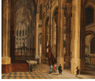
↗ Pieter Neeffs d. J. (*Antwerpen 1620 - † Antwerpen 1675), Maler Kircheninneres (Blick in den Chor von St. Eustache, Paris) , undatiert