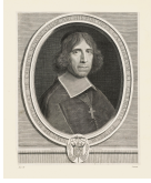
↗ Robert Nanteuil (*Reims 1623 - † Paris 1678), Stecher Bildnis Montpezat de Carbon , 1673