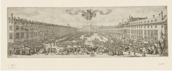
↗ Jacques Callot (*Nancy 1592 - † Nancy 1635), Radierer Turnier auf der Carrière in Nancy , um 1630