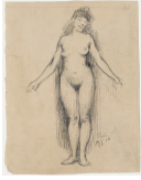
➤ Schule von Henri Matisse (*Le Cateau (Nord) 1869 - † Nizza 1954), Zeichner Weiblicher Akt , 1906