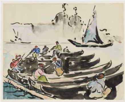
Digitalisierung der französischen und japanischen Graphik