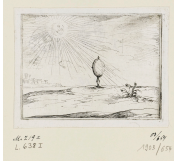
↗ Jacques Callot (*Nancy 1592 - † Nancy 1635), Radierer Sonnenstrahlen, Blatt 12 der Folge "Vita beatæ mariæ virginis matris dei emblematicus" , 1625-1629