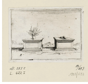
↗ Jacques Callot (*Nancy 1592 - † Nancy 1635), Radierer Zwei Herzen , Blatt 24 der Folge "Lux Claustrii", um 1626/28