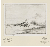
↗ Jacques Callot (*Nancy 1592 - † Nancy 1635), Radierer Ein Krebs, die Sonne betrachtend, Blatt 18 der Folge "Lux Claustri", 1628