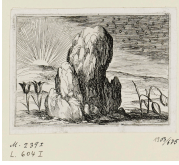
↗ Jacques Callot (*Nancy 1592 - † Nancy 1635), Radierer Tulpen und die Sonne, Blatt 6 der Folge "Lux Claustrii", 1628