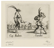
↗ Jacques Callot (*Nancy 1592 - † Nancy 1635), Radierer Capitaine Babeo - Cucuba, Blatt 16 der Folge "Balli di Sfessania" , um 1621/22