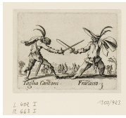
↗ Jacques Callot (*Nancy 1592 - † Nancy 1635), Radierer Taglia Cantoni - Fracasso , Blatt 24 der Folge "Balli di Sfessania", um 1621/22