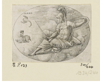
➤ Etienne Delaune (*Paris oder Orléans 1518 - † Paris 1583), Stecher Mars, Blatt 5 der Folge "Planeten", 1575