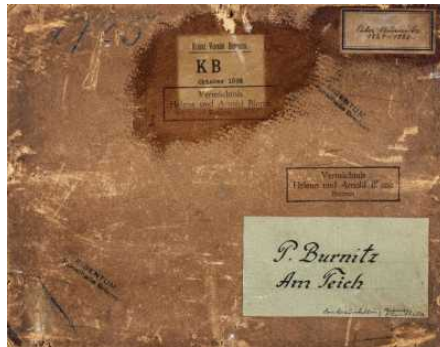
Provenienzforschung in der Kunsthalle Bremen