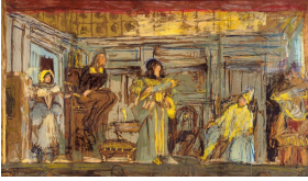
➤ Édouard Vuillard (*Cuiseaux/Saône-et-Loire 1868 - † La Baule 1940), Maler Wandbildentwurf für das Théâtre des Champs Élysées nach Molières Komödie »Der eingebildete Kranke« , 1912/13