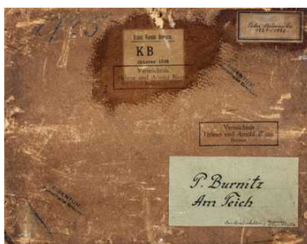
Provenienzforschung in der Kunsthalle Bremen