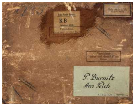
Provenienzforschung in der Kunsthalle Bremen