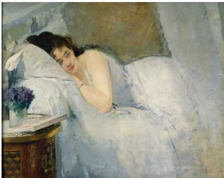
Französische Malerei vom Klassizismus zum Kubismus

Enthalten in der Kollektion: ➤ Französische Malerei vom Klassizismus zum Kubismus ➤ Provenienzforschung in der Kunsthalle Bremen