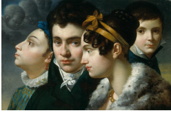
↗ Merry-Joseph Blondel (*Paris 1781 - † Paris 1853), Maler Familienbildnis , 1813