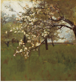
↗ Johann Sperl (*Fürth 1840 - † Aibling 1914), Maler Blühender Apfelbaum , undatiert