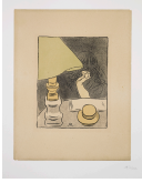
↗ József Rippl-Rónai (*Kaposvár (Ungarn) 1861 - † Kaposvár (Ungarn) 1927), Lithograph Frau und Lampe , 1894