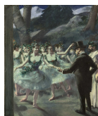
↗ Jean Louis Forain (*Reims 1852 - † Paris 1931), Maler Das Ballett , 1895

Inventarnummer 1542-2012/31 Permalink ↗ DE-MUS-027614/object/15109