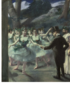
↗ Jean Louis Forain (*Reims 1852 - † Paris 1931), Maler Das Ballett , 1895