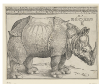
↗ Albrecht Dürer (*Nürnberg 1471 - † Nürnberg 1528), Formschneider Rhinocerus (Das Rhinozeros) , 1515