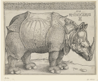
↗ Albrecht Dürer (*Nürnberg 1471 - † Nürnberg 1528), Formschneider Rhinocerus (Das Rhinozeros) , 1515