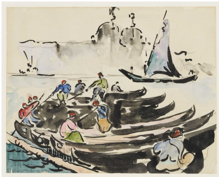
Digitalisierung der französischen und japanischen Graphik