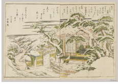
↗ Katsushika Hokusai (*Edo 1760 - † 1849), Formschneider Besuch im Winter , 1775-1849