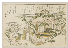
↗ Katsushika Hokusai (*Edo 1760 - † 1849), Formschneider Besuch im Winter , 1775-1849