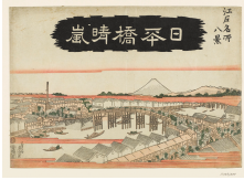
↗ Ikeda Eisen (*1790 - † 1848), Formschneider Nihon-Brücke in Edo mit dem Berg Fuji im Hintergrund , 1805-1848