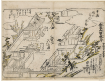
↗ Hishikawa Moronobu (*1618 - † 1694), Formschneider SŌrin-Tempel , 1633-1694