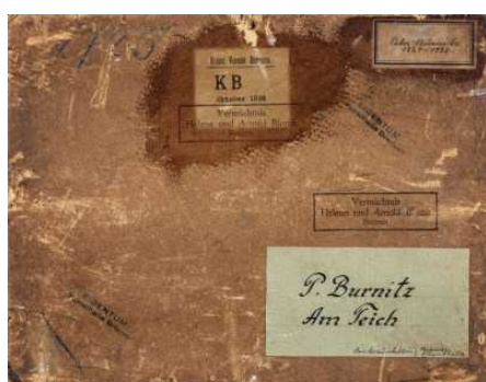
Provenienzforschung in der Kunsthalle Bremen

Enthalten in der Kollektion: ↗ Provenienzforschung in der Kunsthalle Bremen