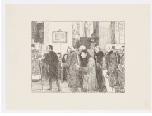
↗ Lucien Joseph Simon (*Paris 1861 - † Sainte-Marine 1945), Lithograph Küster , 1897