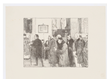
↗ Lucien Joseph Simon (*Paris 1861 - † Sainte-Marine 1945), Lithograph Küster , 1897